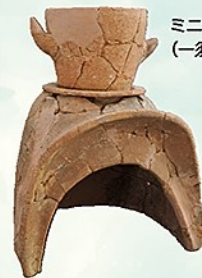
ミニチュア炊飯具 (一須賀Q-1号墳)

※近つ飛鳥博物館では、「我がまちが誇る遺跡」コーナーで北海道余市町と群馬県藤岡市を、「新発見考古速報」コーナーでは古墳時代～近世の遺跡を展示しています。