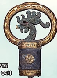
半龍環頭大刀柄頭 (一須賀WA-1号墳)