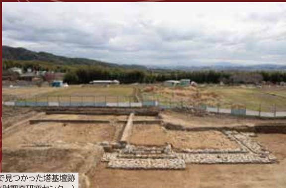
かしのき 栢ノ木遺跡で見つかった塔基壇跡

今回の展示では、飛鳥時代から平安時代初めの四天王寺の歴史を紐解きます。それにより、四天王寺が当時の国家といかに結びつき、伽藍を守り伝えられたかをご理解いただくとともに、中央集権国家の整備から確立、そして衰退期にいたる激動の時代の片鱗を感じていただければと思います。