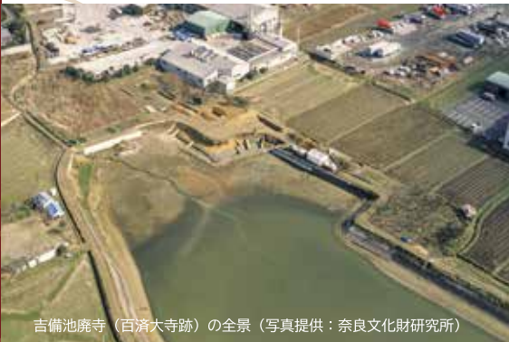
吉備池廃寺（百濟大寺跡）の全景