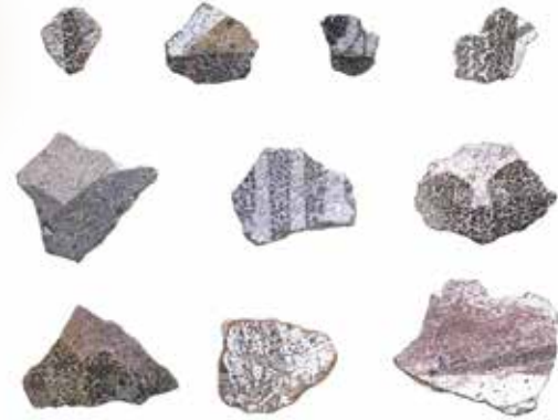
法隆寺若草伽藍跡から出土した焼けた彩色壁画片 (所蔵/保管：法隆寺/斑鳩町教育委員会)