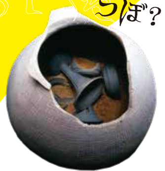
シシヨツカ古墳出土須恵器 大阪府教育委員会 所蔵