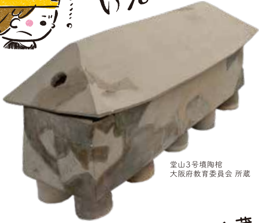
堂山3号墳陶棺 大阪府教育委員会 所蔵