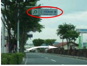
緑ヶ丘交差点付近（右折）