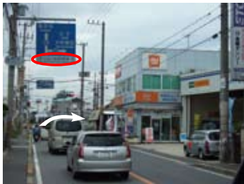
中野町3丁目交差点（右折）

道なりに進むと、中野町3丁目交差点にでます。交差点を右折します。（太子・大和高田方面へ）