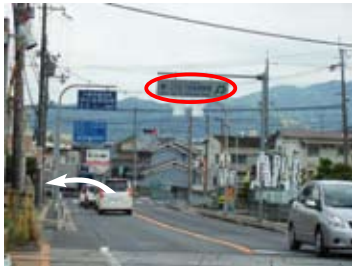
若松町5丁目交差点（左折）