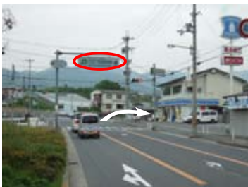
上宮学園南交差点（右折）