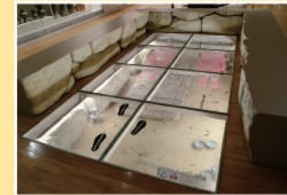
11 이치스카0-5호분 출토상황 재현