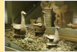
8 물새형 하니와 (복제품) 후지이데라시 츠도우시료야마고분