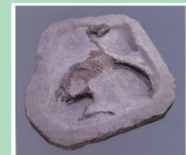
14 시토미야 키타유적 마매납토갱 매장상태 그대로 유적에서 잘라내어 전시하고 있습니다.