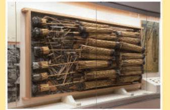
10 부장고매납시 재현 후지이데라시 아리아마고분