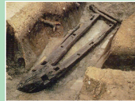
13 수라 (국가지정 중요문화재) 수라는 길이 8.8m·무게 3.2t의 고분시대의 목조(말이끄는)철매입니다. 14년간의 보존처리과정을 걸친 결과, 미래에 전할 수 있게 되었습니다. 후지이데라시 미즈즈카고분