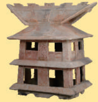
7 집모양 하니와 (국가지정 중요문화재) 야오시 미소노고분