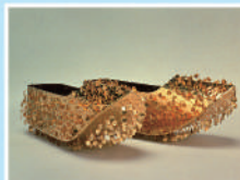
3 금동제 신발 (복원 모조품) 이치스카WA1호분