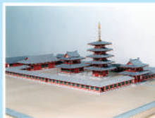
4 시텐노지(사천왕사)의 가람모형 쇼토쿠태자에 의해 지어진 사원입니다.