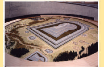
12 닌토쿠능 고분의 모형 측척 150분의 1의 모형입니다. 고분의 주변에는 고분제작이나 당시의 사람들이 생활하고 있는 모습을 나타내고 있습니다.