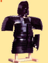
9 충각부주·괘갑 (복원 모조품) 후지이데라시 나가모지야마고분