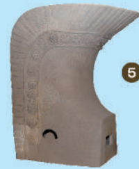
5 연화문대치미 (복제품) 오사카시 시텐노우지 효고현 히메지시 아카사카 1호가마