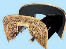
1 금동제 안장장식 (복원 모조품) 하비키노시 콘다마루 야마고분고분