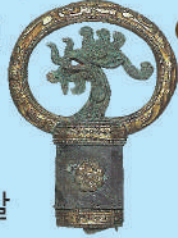
2 금동제단봉문환두대 타이시초·카난초 이치스카고분군