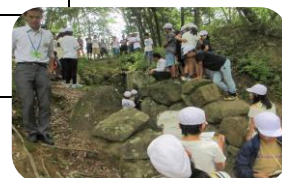
古墳めぐり ウォークラリー