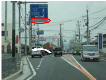
中野町3丁目交差点（左折）