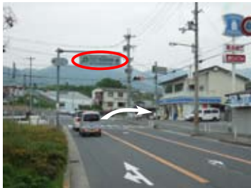
上宮学園南交差点（右折）